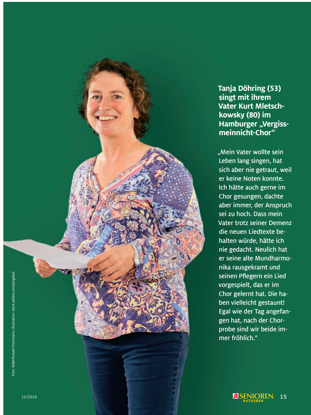
Foto: W&B/Ronald Frommann; Illustration: stock.adobe.com/pingebat

„Mein Vater wollte sein Leben lang singen, hat sich aber nie getraut, weil er keine Noten konnte. Ich hätte auch gerne im Chor gesungen, dachte aber immer, der Anspruch sei zu hoch. Dass mein Vater trotz seiner Demenz die neuen Liedtexte behalten würde, hätte ich nie gedacht. Neulich hat er seine alte Mundharmonika rausgekratzt und seinen Pflegern ein Lied vorgespielt, das er im Chor gelernt hat. Die haben vielleicht gestaunt! Egal wie der Tag angefangen hat, nach der Chorprobe sind wir beide immer fröhlich.“